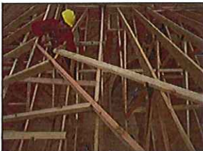
Serás adiestrado por el patrono para obtener nuevas destrezas...

Este adiestramiento se realiza mediante el uso del salón de clases en instituciones educativas, ya sea