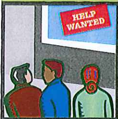
Tan pronto te dediques a la búsqueda de trabajo, te enfrentarás a la solicitud de empleo.

☞ Certificado de Nacimiento-Los patronos verifican tu fecha de nacimiento, así que es buena idea que tengas una copia a la mano.